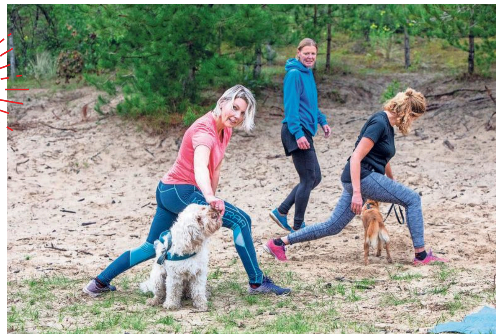
De oefening buigen voor de koning waarbij de hond onder het been doorloopt.

Sporten in de buitenlucht is ongekend populair. De komende weken gaat de redactie op zoek naar bijzondere sporten. Verslaggever Elizabeth Stilma stort zich deze week op Woofcamp: Bootcamp voor mens en hond.