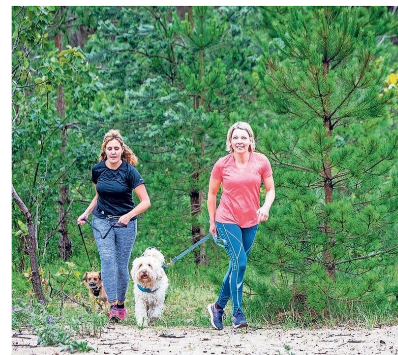
Hardlopen door de boompjes.